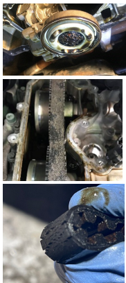
Imagen 2. Problemas en un motor PSA 1.2 PureTech

La correa sumergida en aceite se descompone de forma muy prematura, antes de lo 60.000km.